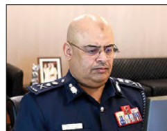
رئيس الأمن العام

المتخصصة لتعميم التجربة، على أن تتولى الأكاديمية مسؤولية الجانب التدريبي لإعداد كوارس المديرية الأمنية ليكونوا قادرين على القيام بدورهم وفق المعايير العلمية المعتمدة. ومنذ الفریق طارق بن حسن الحسن رئيس الأمن العام رئيس المجلس تشكيل الأكاديمية هيئة استشارية للتدريب الميداني، مشيداً ب دورها الفعالي في تعزيز التدريب الميداني وثقافة الاضباط، إذ سيتم في المرحلة المقبلة زيادة الاعتماد بالمعملية التدريبية، بما يعكس على أداء مشيبي وزارة الداخلية.