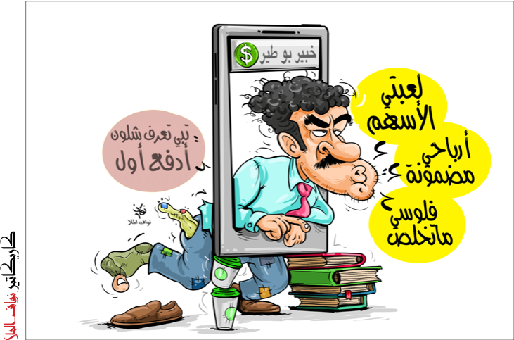
كاركاتير: فؤاد المراد

لهذا، انتقد قطاع واسع من الرأي العام العالمي الجماهيري والرسمي ما حدث من ترامب، حيث أكد شيفان زايربت المتحدث باسم التكنولوجيا والعلاقة وأنها لنسا أحراراً تماماً في التعبير عن رأينا، ولنسا كما كنا نظن أمام إعلام مفتوح دون قيود، بل ربما نعيش من نوع خاص وروية وحدود الحريات المنوطة. لهذا، انتقد قطاع واسع من الرأي العام العالمي الجماهيري والرسمي ما حدث من ترامب، حيث أكد شيفان زايربت المتحدث باسم التكنولوجيا والعلاقة وأنها لنسا أحراراً تماماً في التعبير عن رأينا، ولنسا كما كنا نظن أمام إعلام مفتوح دون قيود، بل ربما نعيش من نوع خاص وروية وحدود الحريات المنوطة.