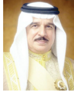
عامل البلاد المفدى

هنا حضرة صاحب الجلالة الملك حمد بن عيسى آل خليفة، عامل البلاد المفدى حفظه الله ورعاه، بطل كمال الأجسام البحريني سامي الحداد بمناسبة الإفراج عنه وعودته سالمًا معافى وجميع البحارة البحرينيين إلى أرض الوطن. وأعرب جلالتنا، في اتصال هاتفى أمس، أجراه مع سامي الحداد، عن تقديره للبطال الحداد ولكافة أبناء البحرين الذين قدموا الكثير لوطنهم ورغوا رايته في العديد من المحافل والمنتديات الإقليمية والعالمية، مؤكداً جلالتنا رساه الله اعتزازه وتقديره واهتمامه بجمع المواطنين، وأن جهود الدولة موجهة لخدمتهم وتقديم كل الدعم والرعاية لهم أينما وجدوا.