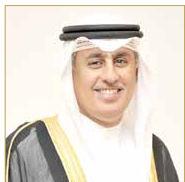
وزير التجارة والصناعة والسياحة

والدولية، التي قدرت بـ 450 حفل زفاف، ما ترتب عليه خسارة 10.8 مليون دينار، فضلًا عن إلغاء 55 زيارة لبواخر سياحية يقدر مجموع أعداد السياح على منها بـ 100 ألف سائح، ما تسبب في خسارة الرسوم لميناء خليفة بن سلمان والشركات السياحية البحرينية المنظمة وللمرشدين السياحيين.