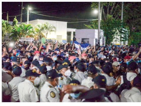
المهاجرون لدى اختراق الطوق الأمني لدخول غواتيمالا.

وتزويد عدد أكبر من الجرعات في الفصل الثاني، من العام. وأضافت «سنعود إلى الجدول الزمني الأساسي لعمليات التسليم في الاتحاد الأوروبي اعتباراً من أسبوع ٢٥ يناير، مع زيادة عمليات التسليم بدءاً من أسبوع ١٥ فبراير. وأشارت المجموعات إلى أنه من أجل القيام بذلك، يجب بعض التعديلات على عملية الإنتاج ضرورية، وكانت فايزر وبايونتيك حذرتا الجماعة بشكل غير متوقع من أهمها لن تتمكن من تسليم دول الاتحاد الأوروبي، حتى مطلع