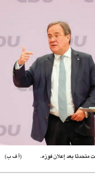
لائنت محققاً بعد إعلان فوزه.

برلين - (أ ف ب): اختار حزب الاتحاد الديمقراطي المسيحي الألماني الاستمرار في سياسة أنجيلا ميركل بالتصويت المعتدل لثلاثين لياًساً جديداً له يوم السبت الذي فاز على الليبرالي فريدريش ميرتس المؤيد لالتفات نحو اليمين. وبغالبية ٥٢١ صوتاً من أصل ١٠٠١ مندوب تمت تعويته لارلاء بأصواتهم، فاز لائنت على منصب الذي حصل على ٤٦٦ صوتاً في الجولة الثانية من الانتخابات الداخلية. ويات بذلك في موقف جيد لقيادة المعسكر المحافظ في الانتخابات العامة في سبتمبر، رغم أنه لا يملك ضمانات تامة بعد. وقال لائنت تعليقاً على فوزه، «أريد أن نتج معاً وأن نضمن أن يصل الاتحاد، المحافظ الألماني الذي يضم الاتحاد المسيحي الديمقراطي والحزب الشقيق الليبرالي الاتحادي الاجتماعي المسيحي، في الانتخابات في سبتمبر. واستفاد لائنت الذي حل ثانياً بعد ميرتس في الجولة الأولى من أصوات المرشح ثالث هو نوربرت روتغن مؤيداً للمؤيد لخط معتدل ورائع خسر من الدورة الأولى.