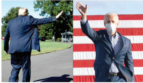
ترامب لا يرغب في مغادرة واشنطن كرئيس سابق.

واشنطن - والوكالات: سيغادر الرئيس الأمريكي المنتهية ولايته دونالد ترامب واشنطن فجر الأربعاء قبل ساعات من تنصيب خلفه الديمقراطي جو بايدن، الذي لم يهتبه بالفوز بعد. ومن الواضح أن ترامب لا يرغب في مغادرة العاصمة الفيدرالية الأمريكية صفة رئيس سابق، لذلك سيوجه قبل انتهاء ولايته إلى فلوريدا وعمره الفاضل في مارلا أوتو حيث يقضي الأسفار. ويعد مغادرته مقر الرئاسة على متن مروحية مستلقة من حدائق البيت الأبيض، سيوجه رجل الأعمال السابق من قاعدة أندروز العسكرية (ميريلاند) إلى مارلا أوتو في رحلته الأخيرة على متن طائرة الرئاسة. وفي مدينة واشنطن التي تغيرت معالمها وأصبحت تعبر بمعبري محسنين بعد أعمال العنف التي شهدتها مقر الكونغرس (الكابيتول)، وتواصل الاستعدادات لترأس أداء بايدن اليمين، وسيصبح الديمقراطي الرئيس السادس والثمانين في تاريخ الولايات المتحدة. ويواصل فريق بايدن يومياً متابعة التفاصيل بدقة، وستؤدي ليدى جاجا التي يصفها بايدن بأنها «صديقة عظيمة، الشئد الوطني الأمريكي. لكن الخلل سيكون مختلفاً هذا العام، ذلك أنه سيتم إغلاق موقع «ناوتات» حول الساحة الضخمة أمام مبنى الكونغرس أمام الجمهور. ولن يسمح إلا للأشخاص المحمدين رسمياً بحضور المحطة التي ينحسح فيها تقليدياً أعضا الرئيس المنتخب بمئات الآلاف. ومنذ الهجوم الذي شنه على «الكابيتول» أعضا لترامب في السادس من يناير، وضعت واشنطن تحت المراقبة المشددة، وسيات الشرطة تطويقاً مدعومة بالآلاف الجنود. ودعا فريق بايدن ورئيسه بيلدي واشنطن وباريل الرئيس الشعب الأمريكي إلى تجنب التوتوي الفجائية. وسيطو واشنطن ومطامعة حفل التنصيب عبر الإنترنت أو على شاشات التلفزيون.